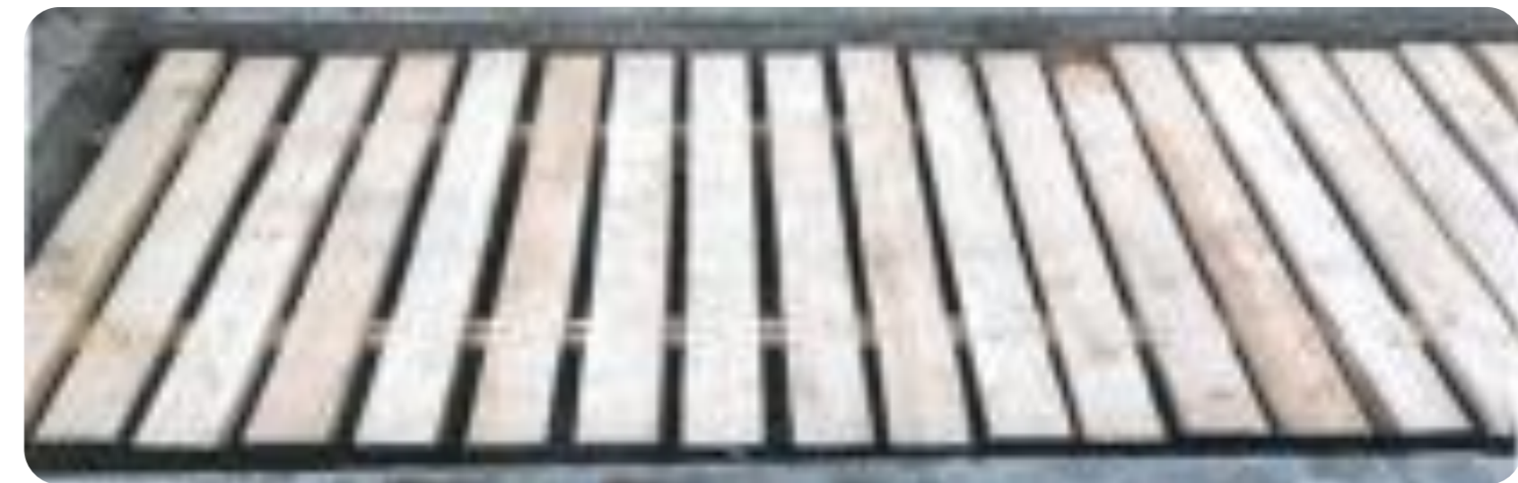
Рис.3 Пример настила лифтовой шахты