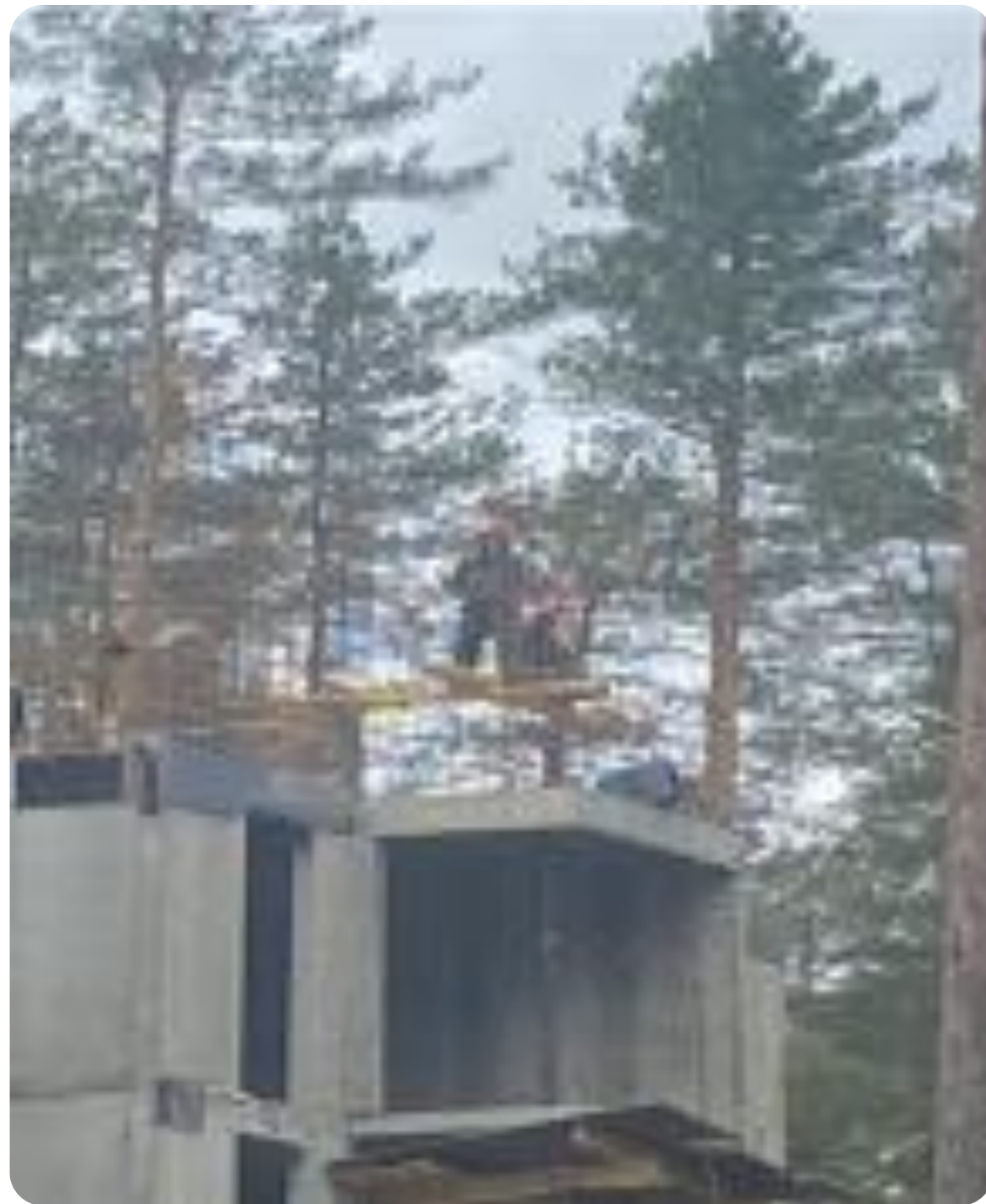
Рис.4 Пример нарушений работниками требований охраны труда