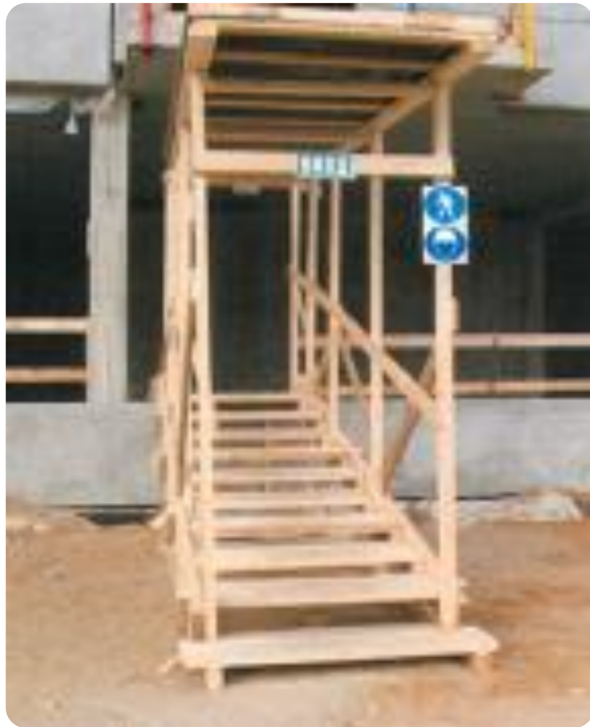
Рис.1 Входная галерея (входная группа)