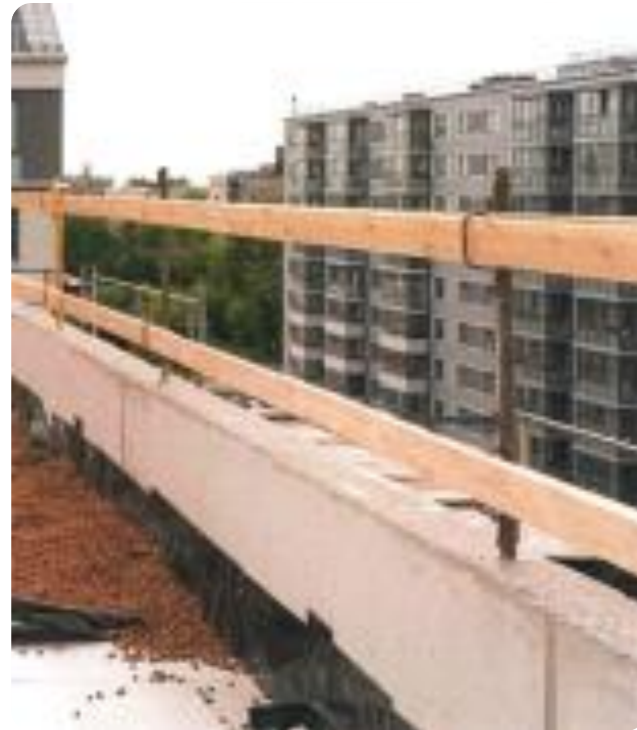
Рис.2 Пример ограждения парапета кровли