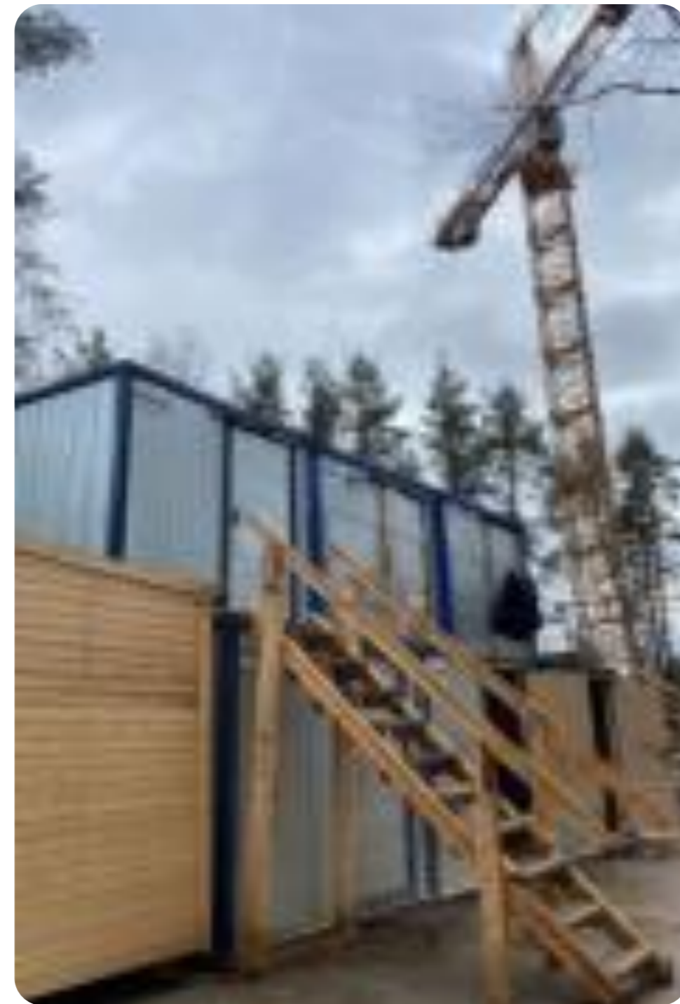
Рис.5 Примеры несоблюдения требований пожарной безопасности